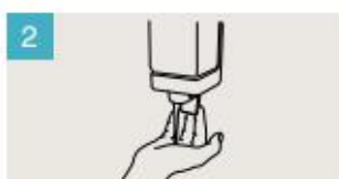
Aplique suficiente jabón para cubrir todas las superficies de las manos.