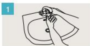
Mójese las manos.

DURACIÓN DEL LAVADO: entre 40/60 segundos