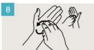
Frótese la punta de los dedos de la mano derecha contra la palma de la mano izquierda, haciendo un movimiento de rotación, y viceversa.