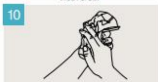
Séquese las manos con una toalla de un solo uso.