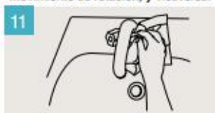
Utilice la toalla para cerrar el grifo.