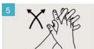
Frótese las palmas de las manos entre sí, con los dedos entrelazados.