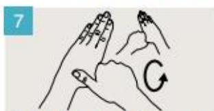
Rodeando el pulgar izquierdo con la palma de la mano derecha, fróteselo con un movimiento de rotación, y viceversa.