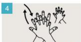
Frótese la palma de la mano derecha contra el dorso de la mano izquierda entrelazando los dedos, y viceversa.